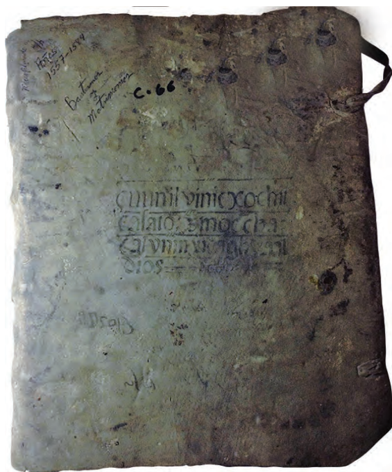
Libro de Bautizos de Comitán