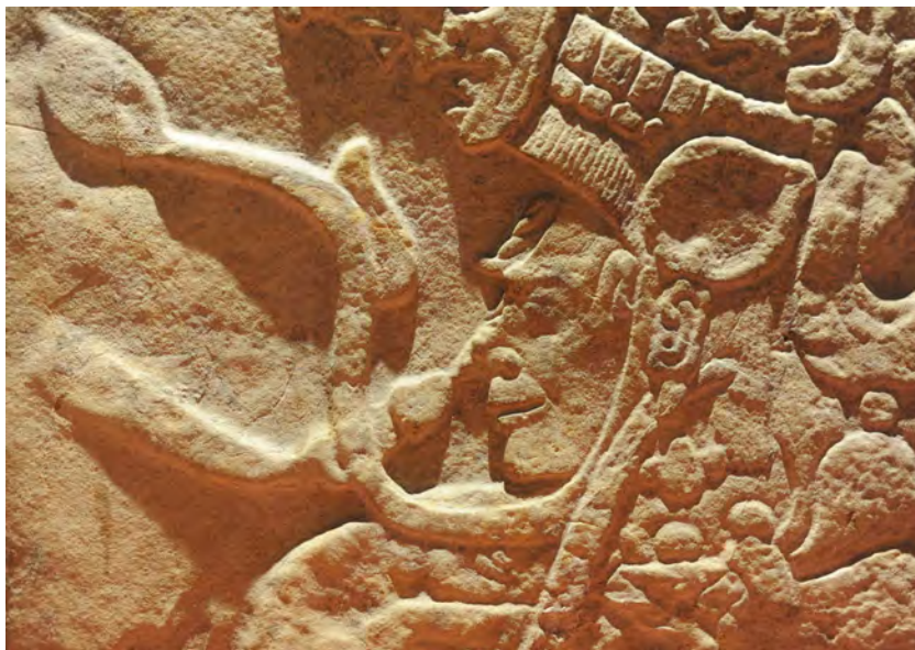
Estela de Chinkultic

Goc, Junchavín y Tenam Puente. Recientemente (1970), el Arqlgo. Roberto Gallegos Ruiz dirigió los trabajos de exploración del cenote