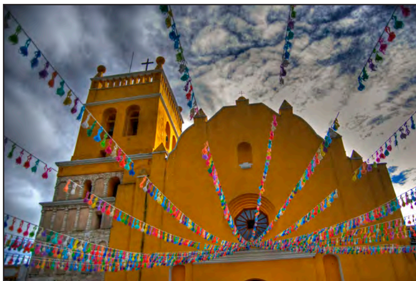
Santo Domingo de Comitán, el quinto convento dominico en Chiapas.

Las etnias de los pueblos mencionados anteriormente: